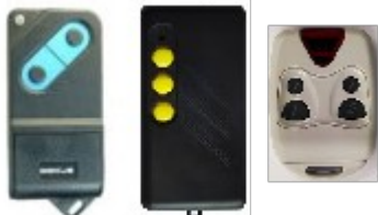
Ex de télécommandes à codes simple